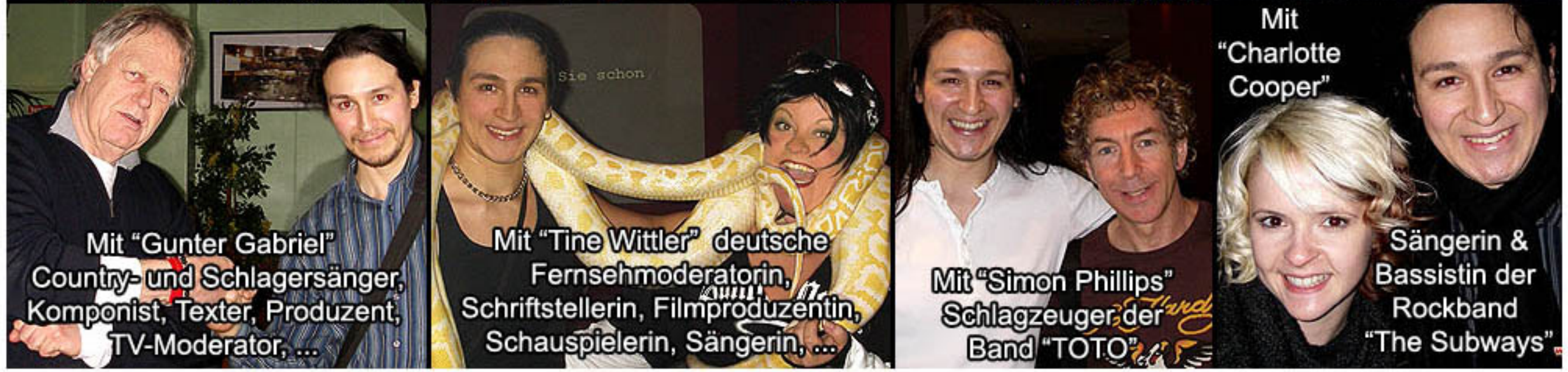
Mit "Gunter Gabriel" Country- und Schlagersänger, Komponist, Texter, Produzent, TV-Moderator, ...