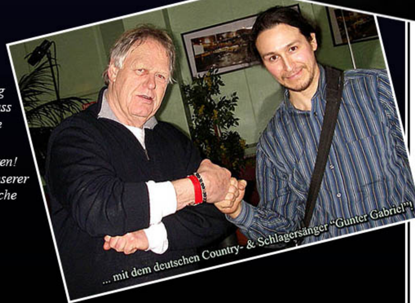
... mit dem deutschen Country- & Schlagersänger "Gunter Gabriel!"