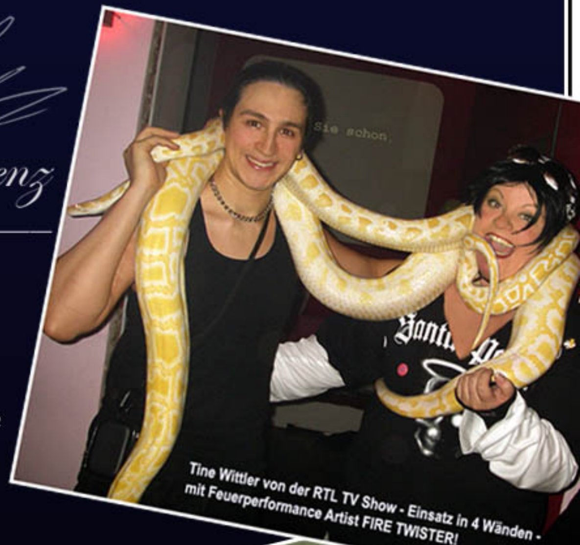
Tine Wittler von der RTL TV Show - Einsatz in 4 Wänden - mit Feuerperformance Artist FIRE TWISTER!

Alle unsere Preise & Angebote sind unverbindlich und werden regelmäßig aktualisiert. Wir behalten uns das Recht vor, Änderungen unserer Preise, sowie der bereitgestellten Informationen und Angebote jederzeit vorzunehmen.