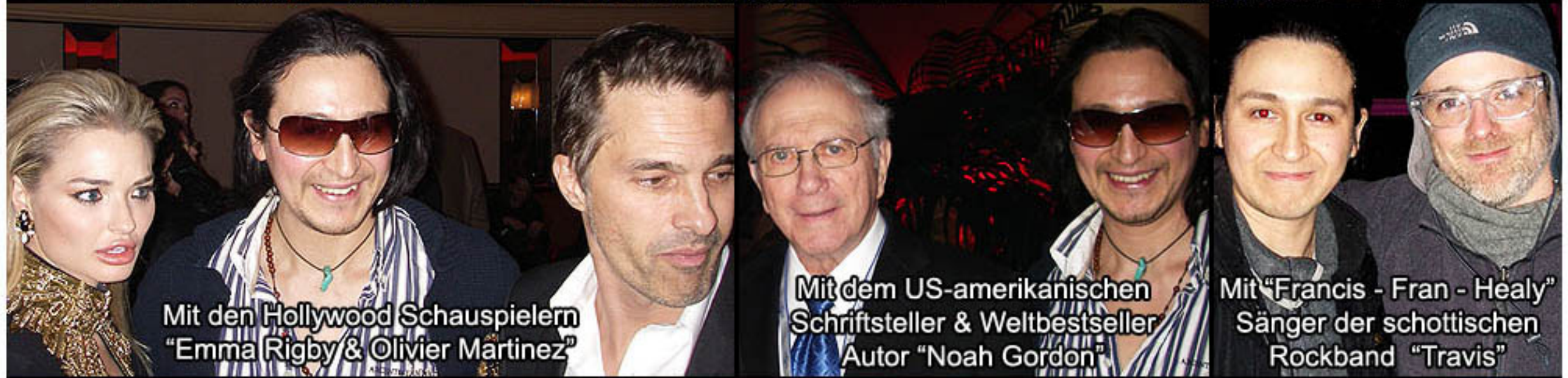
Mit den Hollywood Schauspielern "Emma Rigby & Olivier Martinez"